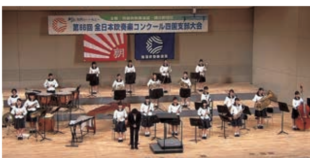
全日本吹奏楽コンクール四国支部大会 (2018年・高知県)

両部に対して、私にはどっちつかずな関わり方しかできていませんが、このような大きな成果が上げられたのは、生徒たちの真摯な努力によるものであることは、間違いありません。