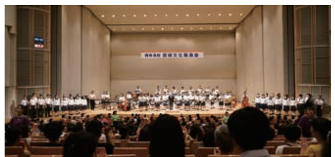
西条高校 芸術文化発表会(2019年) (毎年8月13日 西条市総合文化会館)

関係各所の温かいご理解のもと、何曜日であろうと毎年8月13日に西条高校芸術文化発表会を開催しております。これまで経験させていただいたどの全国大会の会場にも負けない素晴らしい響きの西条市総合文化会館です。ぜひいらしていただけましたら幸いです。 西条高校勤務が決まった時、多感な年頃の私を大切に育んでくれた西条高校に恩返しができると思つて意気込んで赴任しましたが、私の無力を覆い隠してくれる素晴らしい生徒たちのおかげもあって、自分が高校生の頃よりももっと良い経験をさせていただいています。御恩は増すばかりです。死ぬまでとは言いません、せめて定年まで西条高校にご奉公させていただきます!